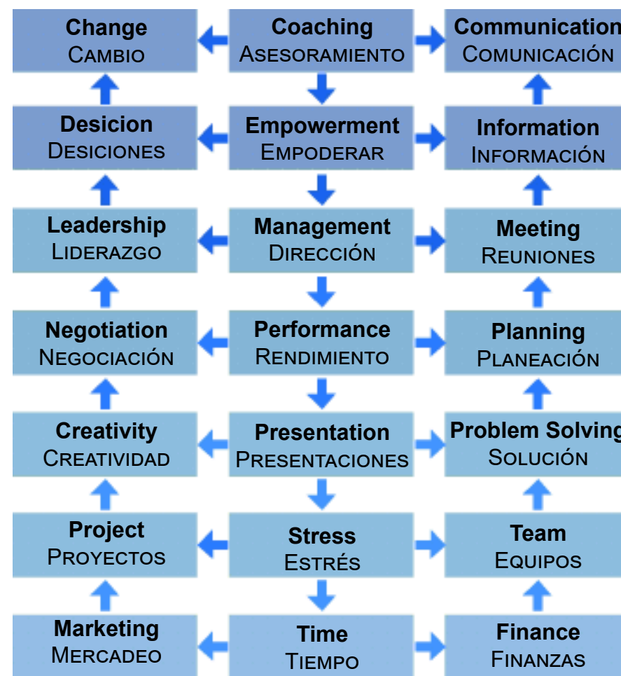
MAPA CURRICULAR DEL PROGRAMA DE HABILIDADES COOPERATIVAS

ORGANIZAMOS TODOS LOS MATERIALES PARA ASEGURAR EXPERIENCIAS DE APRENDIZAJE SIGNIFICATIVO.