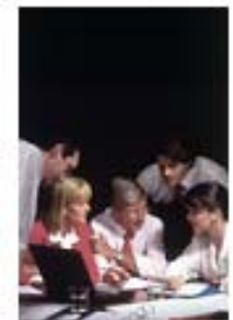
DIDACTICALES para entornos grupales