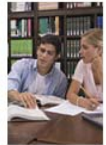
DIDACTICALES para entornos presenciales

Un método de trabajo que asegura materiales didácticos de alto impacto.