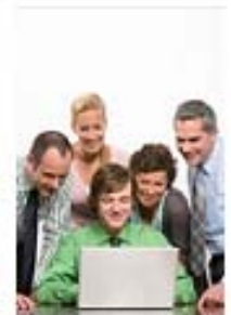
DIDACTICALES para entornos virtuales