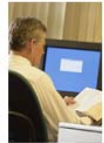
DIDACTICALES para entornos individuales